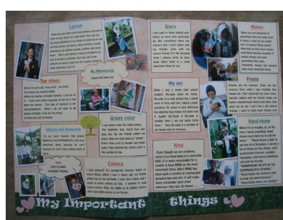
写真3 FP no.2 pp.2-3

(2) WYM2011 での協働発表コンテンツ FP no.1 の編集経験を両校で持ち寄り、「対面、ビデオ会議、email、SNS、チャット等の特色を知り、状況に応じて使い分けること」の重要性について発表をまとめた。同じ ICT を使っていても使い方の違いでギャップが生じる。ICT があれば情報のスムーズなやりとりが保証されるわけではなく、相手と自分が ICT を どう 使うかも念頭に置く必要がある。作成過程での失敗と成功の経験から学んだこのノウハウを、寸劇も織り込んで発表した。この発表のビデオは WYM2011 の公式サイトから閲覧可能である。( http://www.japanet.gr.jp/ )