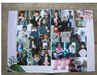
写真2 FP no.2 表紙