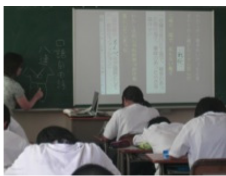
写真2 授業時の教員利用