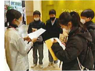
企業訪問先でインタビュー

・右の写真は、洋服の販売店にSDGsについて質問している様子で、班ごとに異なった業種の事業所を事前に調べ、質問内容を検討し、調査した内容をロイロノートにまとめ発表した。ただ単にSDGs 17の項目に当てはまるかどうかの知識に留まることなく、各教科等の学びを基盤としつつ、様々な情報を得てGIGA 端末などを活用しながら、課題の発見・解決できる資質・能力の育成に努めている。