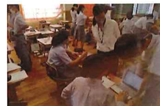
大学生も初めてのコラボに試行錯誤

・授業の単元振り返りプレゼンテーションと興味を持った事象のプレゼンテーションについて、文化祭で発表してみたい生徒を募集したところ、約10組の個人またはグループの応募があり、「あつまれ動物の森の人のポケットには、どれくらいの人が入るの?」「確率の不思議～同じ人の誕生日は何%～」「数学が苦手な人でもわかる～1から100の足し算を10秒で解く方法」「検証～シュークリームの上質な食べ方～」など日頃の何気ない疑問について真面目にユニークに発表する姿に、聞き手も興味を持ちながら、小さな空間の中で発表しているかのような一体感のある温かい雰囲気を感じ取れた。