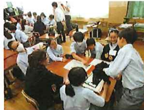
アイスブレイキングで コミュニケーション

・本校で、もう一つ大切にしていることは、多様性の教育である。人権を基盤とした学習指導と生徒指導の一体化を目指した取組に、朝鮮初級中級学校と