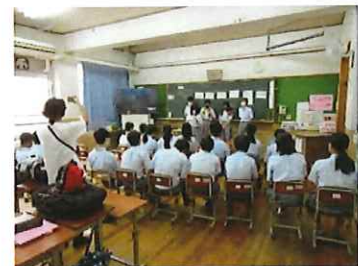
プロの俳優さんの演技を学び、シーンの1場面を創作

・芸術家の派遣により、生徒の豊かな想像力・創造力や思考力コミュニケーション能力などを養うとともに、将来の芸術家や観客層を育成し、優れた文化芸術の創造を目的に実施した。劇団員と国語科との綿密な打ち合わせを行い、国語の授業「故郷」という作品を通して、表現力・読解力の向上をはかる。全5時間の講義+体験型に構成され、自分の生き方や社会との関わり方を支える読書の意義と効用について、ま理解した、自分の考え