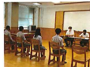
面接検定の様子 1年生～3年生全校実施

・本校独自で実施している面接検定では、3年時における進学・就職のための模擬面接ではなく、3年間の継続的な取組として、「話す力・思いを伝える力」をつけるべく1年生から取り組んでいる。学級では事前に面接の基本的な知識を習得してから、教頭・校長が面接官を担当する。事後指導として、次の面接検定だけでなく、日々の授業にも生かすために振り返りを重視している。1年生は、「自己PR」「身近な出来事」「1年間の振り返り」、2年生は、「1年間の振り返り」「社会の出来事」「未来の大人像」などの質問内容について、「根拠を示し・順序立てて・簡潔に伝える」ことを注意しながら、相手が納得するように返答しなくてはならない。