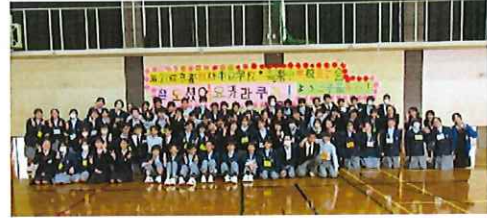
文化交流だけでなく、人権教育も 取り入れている(SDGs)

の交流会、多様な国籍の同年代のインターナショナルスクールとの交流会を取り入れ、教科横断的(国語・社会・英語・音楽・道徳)になるよう工夫し、生徒たちが新たな価値観や多様性を創造し、交流を通して実社会での問題発見・解決に生かしていくための学習を推進している。