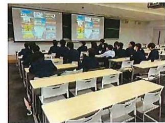
大学で取り組んでいるSDGsを調査

・2年生では、6月に実施した「生き方探究チャレンジ体験」に引き続いて、キャリア教育の一環で、大学訪問を実施した。訪れた大学では、建学の精神に基づく「良心教育」を展開し、個々の学びを探究する到達点に、SDGsと関連付けて、社会面・環境面を考慮しながら、経済活動を持続可能な形で発展させるための研究をしている学生の紹介があった。本校の生徒たちは、「中学生にできるSDGsは何か」といった質問が多く、自ら主体的に社会に貢献しようとする姿や、将来の夢を実現するために、これからの中学校生活について深く考えることができた。