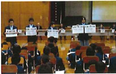
小学校で取り組んでいる プチあと検定

どの単元のノートを検定するのは、体育館に集合してから学習協力委員によって知らされるため、日頃からノート作りに取組まなければならない仕掛となっている。1級ノートは全校生徒に紹介され、担当教員から良かった点をみんなで共有する。