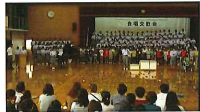
保護者や地域の方々を招待

・校区小学校の6年生児童と中学校1年生～3年生で実施。学校紹介があり、各学年の合唱を披露した後、子どもたち全員で合唱を響かせた。閉会では中学生と児童とが、互いの歌声の感想を交換し、中学校入学を楽しみしている言葉など満足感が得られる取り組みとなった。児童の合唱練習は、本校の音楽教員が、それぞれの小学校に出前授業を数回行い本番に備えた。中学生(美術部)が描いたポスターをPTAの自宅や、地域の掲示板・保育園・幼稚園などに掲示し、多くの保護者や地域の方々に参観に来て頂いた。