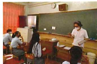
大学教授から芸術の世界を学ぶ

・上記、文化芸術による子供育成推進事業ならびに京都芸術教育研究事業によって培われた表現力は10月に行われた文化祭において、3年生による人権劇でその成果を発揮することができた。大学教授の講義では、創作技術のポイントを聞き、学生は生徒主体の創作になるよう、アドバイスよりも、生徒の考えを承認しながら、良い方向付けになるような支援のみとした。また、当時の情景を自分事のように表現するには、修学旅行先である沖縄の民家宿泊体験学習で、実際に民泊の方から沖縄戦の辛かった思いや現在の願い、基地問題など、現地の方から聞き取った言葉を劇のセリフの中に取り入れる必要があった。台本は自作で制作し、音響・大道具・小道具・照明・美術など演出にこだわりを持って学年全員で作あげた作品となった。